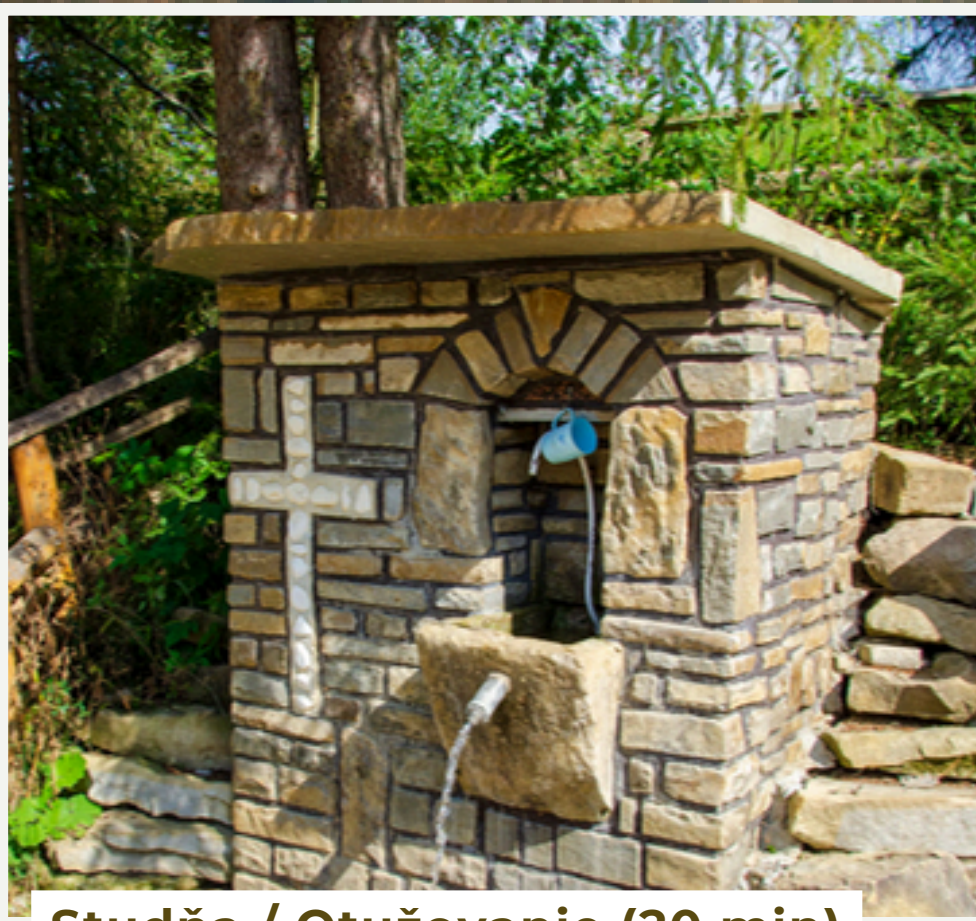
Studňa / Otužovanie (20 min) Studený horský potok.