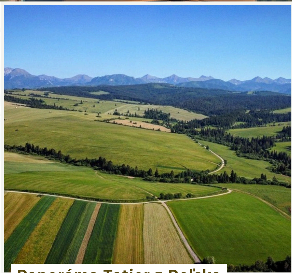
Panoráma Tatier z Poľska Široký horizont a pokojná krajina.