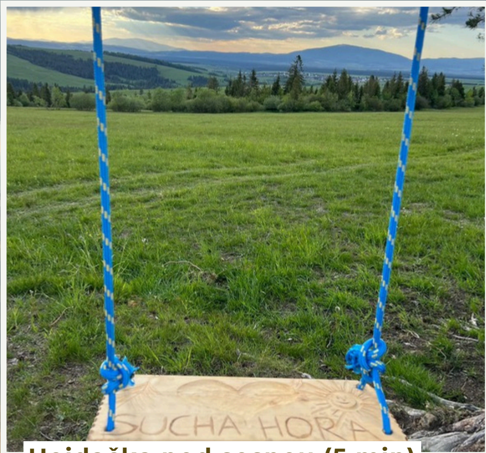
Hojdačka pod sosnou (5 min) Len pár minút od chaty.